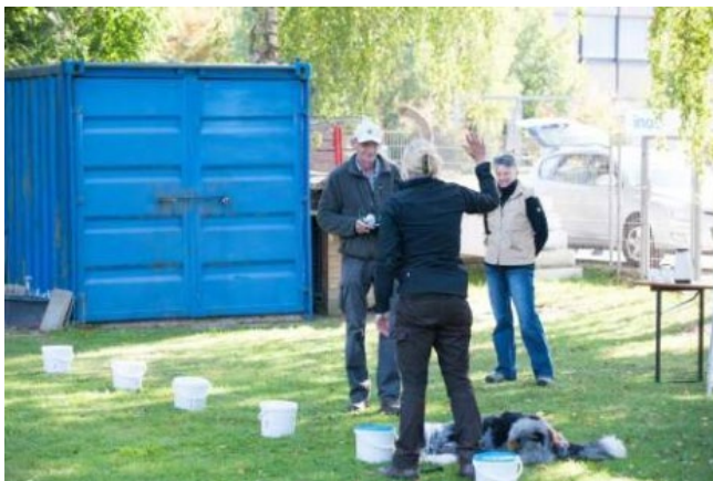
Beispiel Bilder von gleichen Behältnissen (LK 1, bzw.: LK2)

In der LK 3 stehen 10 unterschiedliche Behältnisse in Reihe